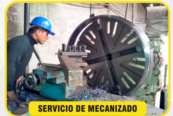
SERVICIO DE MECANIZADO