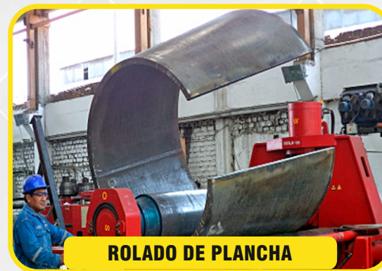
ROLADO DE PLANCHA