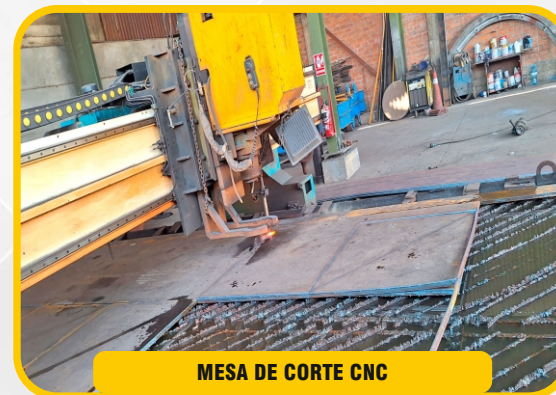
MESA DE CORTE CNC