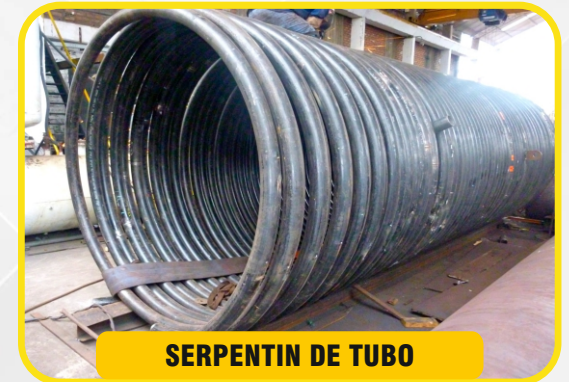
SERPENTIN DE TUBO