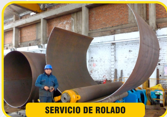
SERVICIO DE ROLADO