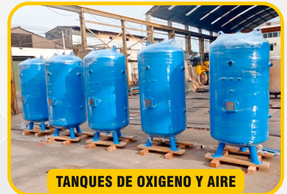
TANQUES DE OXIGENO Y AIRE