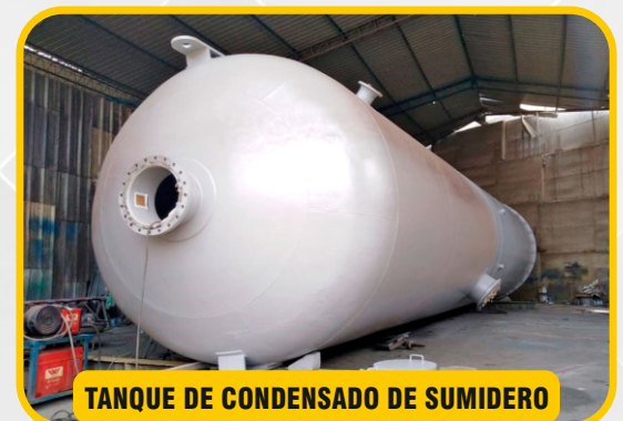
TANQUE DE CONDENSADO DE SUMIDERO