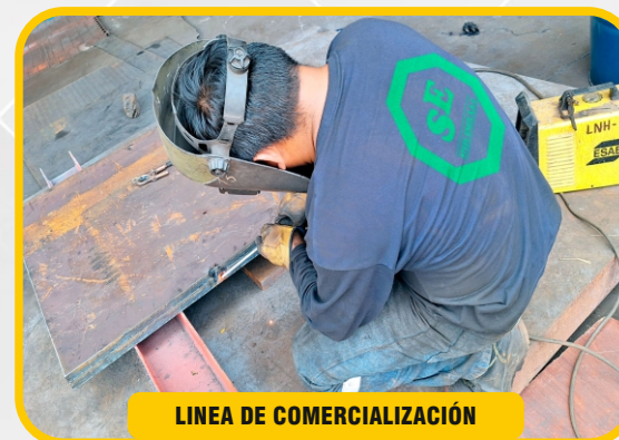
LÍNEA DE COMERCIALIZACIÓN