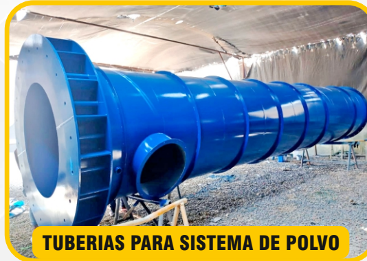
TUBERIAS PARA SISTEMA DE POLVO