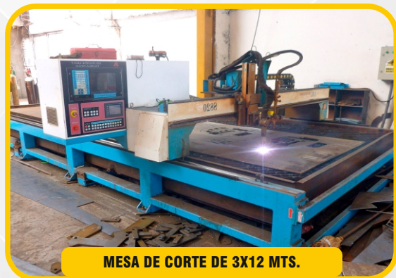
MESA DE CORTE DE 3X12 MTS.