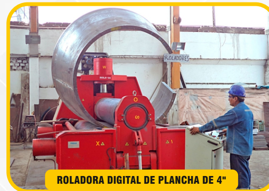
ROLADORA DIGITAL DE PLANCHA DE 4"