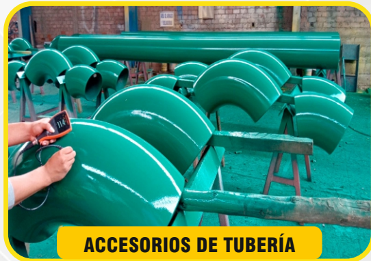
ACCESORIOS DE TUBERÍA