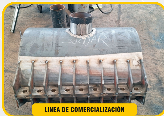
LÍNEA DE COMERCIALIZACIÓN