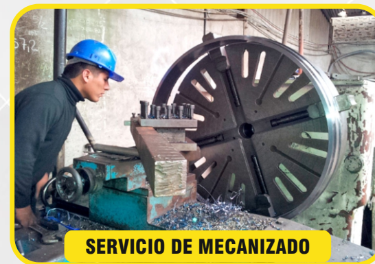
SERVICIO DE MECANIZADO