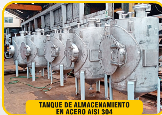
TANQUE DE ALMACENAMIENTO EN ACERO AISI 304