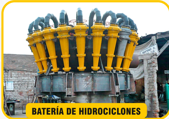
BATERÍA DE HIDROCICLONES