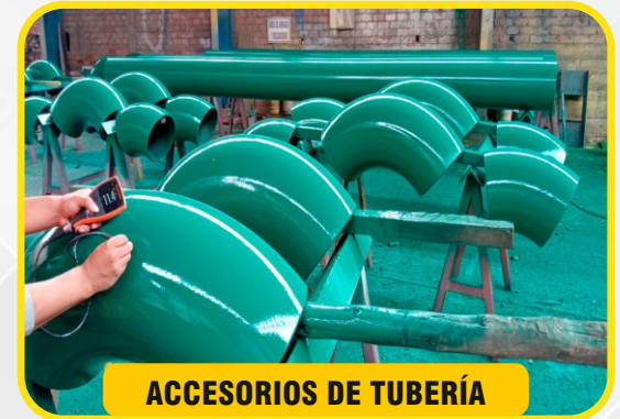
ACCESORIOS DE TUBERÍA