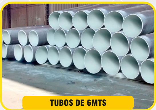
TUBOS DE 6MTS