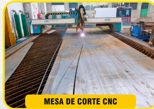
MESA DE CORTE CNC