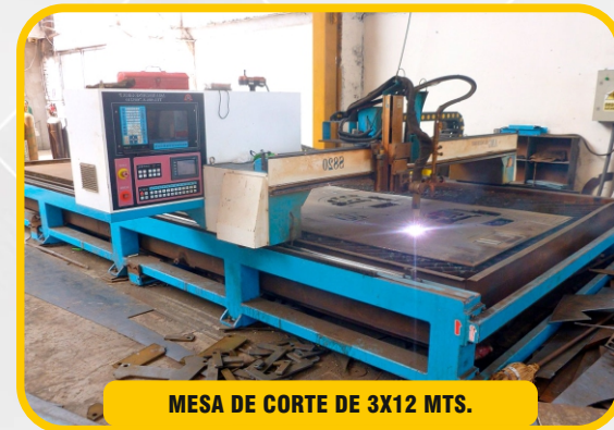
MESA DE CORTE DE 3X12 MTS.