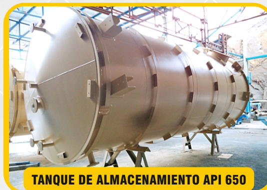
TANQUE DE ALMACENAMIENTO API 650