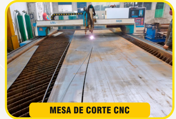
MESA DE CORTE CNC