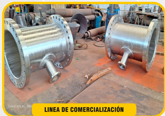
LÍNEA DE COMERCIALIZACIÓN