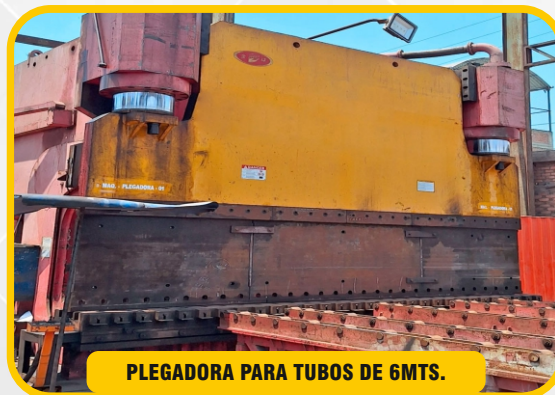
PLEGADORA PARA TUBOS DE 6MTS.